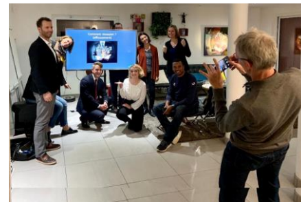
Révèle tes talents ! à Toulouse

=> Echanges avec les associations de diplômés des autres IEPs (partage de bonnes pratiques, retours d'expériences, organisation d'événements et de projets en commun,...), échanges précieux qui ont vocation à s'intensifier !