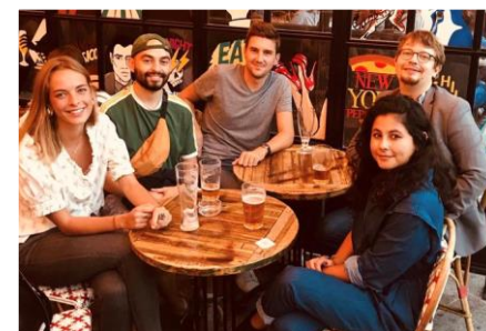
Rencontre entre les membres de Lyon, Rennes, St Germain et Toulouse