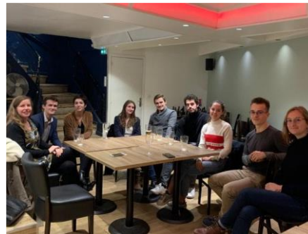
Étudiants de l'Action publique